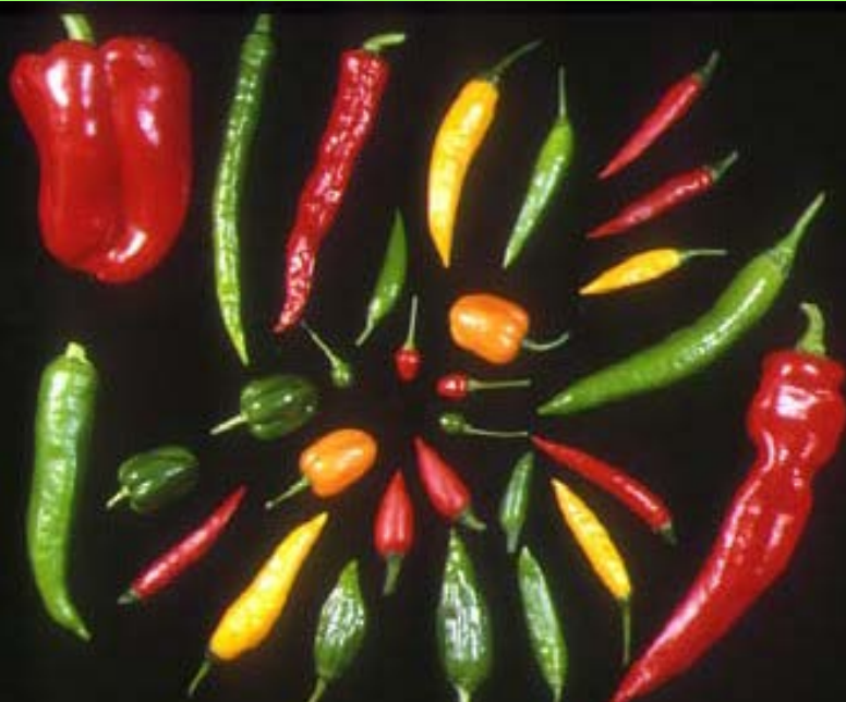
機能性をいっそう高めた「京ブランド赤とうがらし」品種の育成